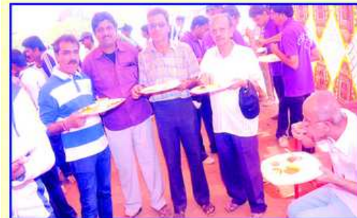
ટુર્નામેંટ પ્રસંગે આયોજીત જમણાની લહેજત માણતા કાર્યકરો