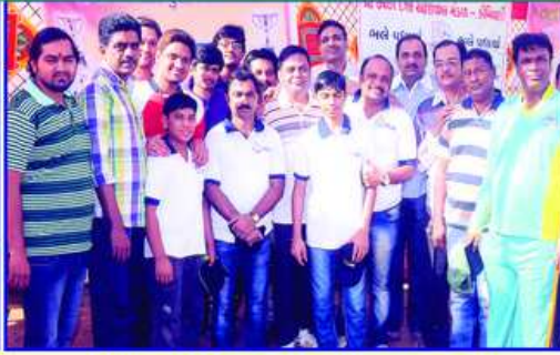
KDO કપ ટુર્નામેંટની શરૂઆત કરતા મંડળના પ્રમુખશ્રી અને કાર્યકરો તથા મુંબઈ મહાજનશ્રીના સેક્રેટરી તથા આમંત્રિતો