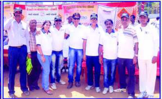
KDO કપ-૨૦૧૩ મેચમા ભાગ લેવા મુંબઈ મહાજનની વ્ય. સમિતિના સભ્યો