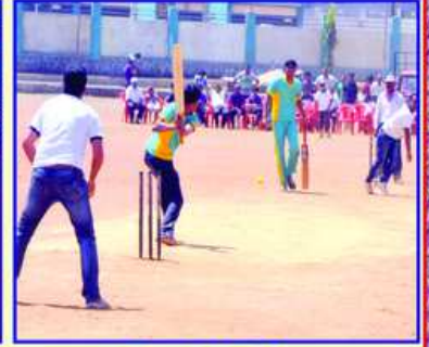
ધારદાર બોલિંગ અને બેટીંગની રમઝટ જમાવતા ખેલાડીઓ અને આનંદ માણતા જ્ઞાતિજનો