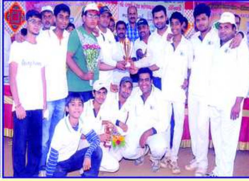
KDO કપ-૨૦૧૩ની રનર અપ મુલુંડ યંગસ્ટર્સની ટીમ