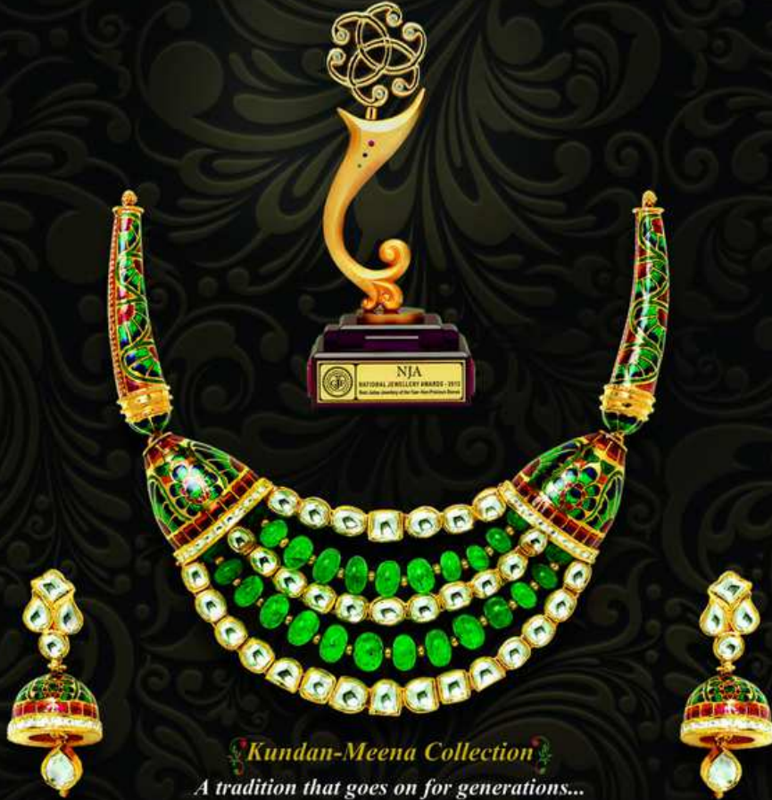
Kundan-Meena Collection A tradition that goes on for generations...