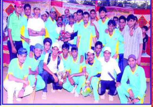
KDO કપ વિજેતા શ્રી રામાપીર જુનિયર ઈલેવનની ટીમ સાથે મંડળના કાર્યકરો